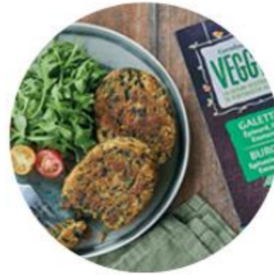
Acte 7 - Doubler la gamme végétarienne