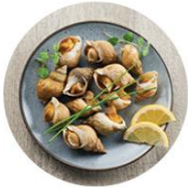
Acte 5 - Garantir une pêche responsable