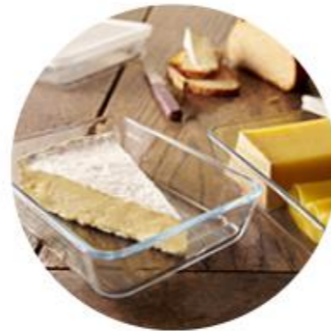
Acte 13 - Réduire les emballages et le plastique