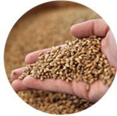
Acte 10 - Aider la conversion au bio