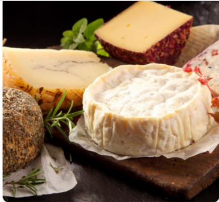
Des prix abordables qui rendent le bio accessible à tous

Carrefour s'engage pour proposer des produits bio de qualité et à prix accessible, pour permettre à tous de mieux manger chaque jour