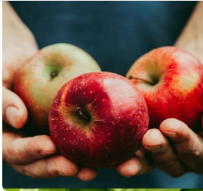
La qualité des produits Carrefour Bio : une valeur rassurante