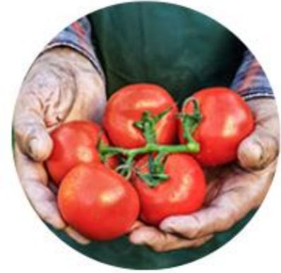
Acte 12 - Fruits et légumes bio de saison