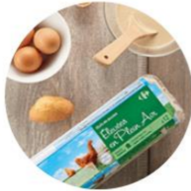
Acte 6 - Nourrir les animaux sans OGM <0,9%