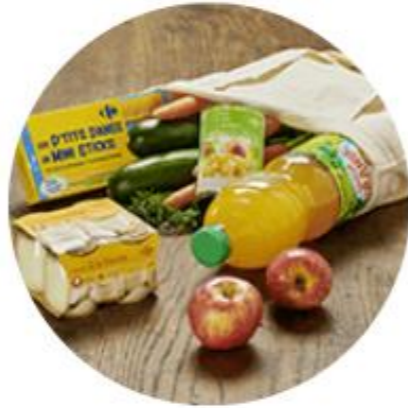
Acte 2 - Exclure 100 substances controversées