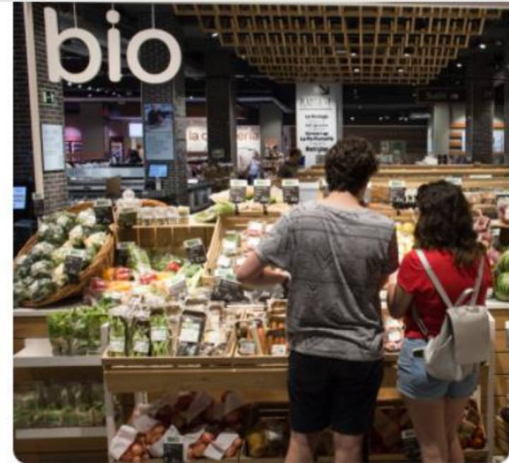
L'ambiance chaleureuse et moderne de nos magasins