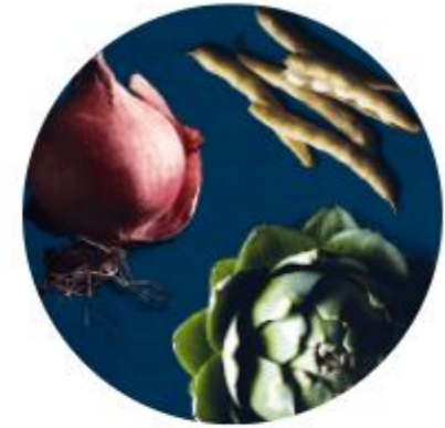
Acte 8 - Favoriser la biodiversité des fruits et légumes