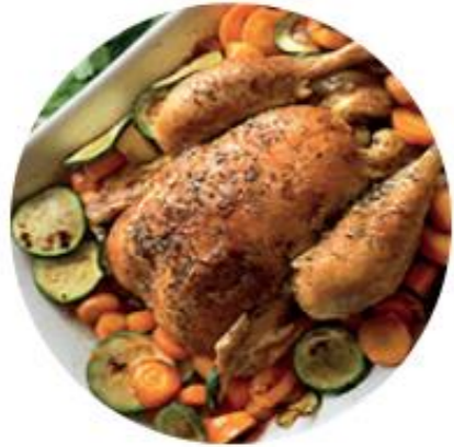
Acte 1 - Garantir le bio 100% Français accessible