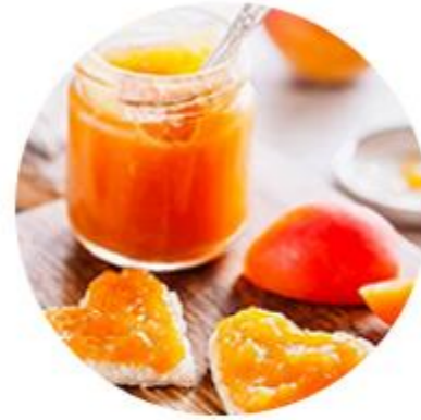
Acte 11 - Lutter contre le gaspillage