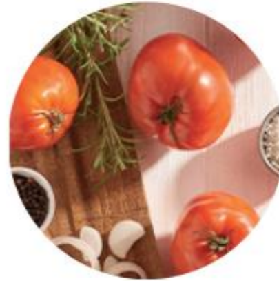
Acte 3 - Supprimer l'utilisation des pesticides