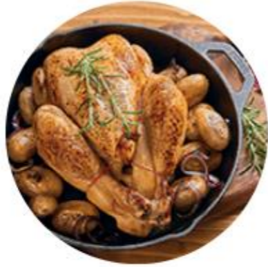
Acte 9 - Garantir la traçabilité